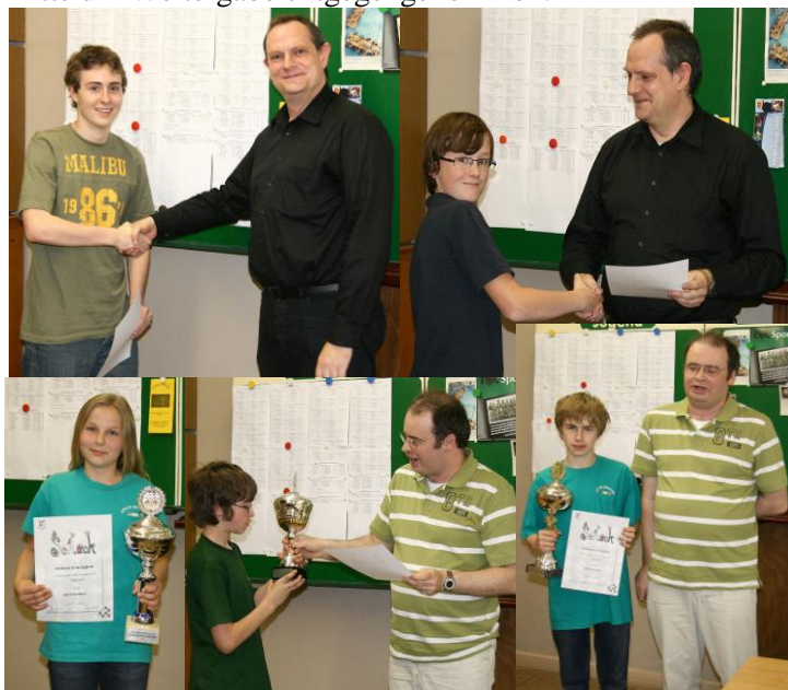
Die beiden Spielleiter überreichen den jugendlichen Meistern ihre Pokale und Urkunden